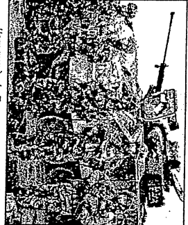
Нова база дивизија - не се знае колку војници ќе ил со придојдениот не екстремистичкиот

Во Скопје по завршувањето на преговорите во Рамбуле, а од владините кругови во Скопје се надеваат оти бројките за нови сини војници на земјата се наудни.